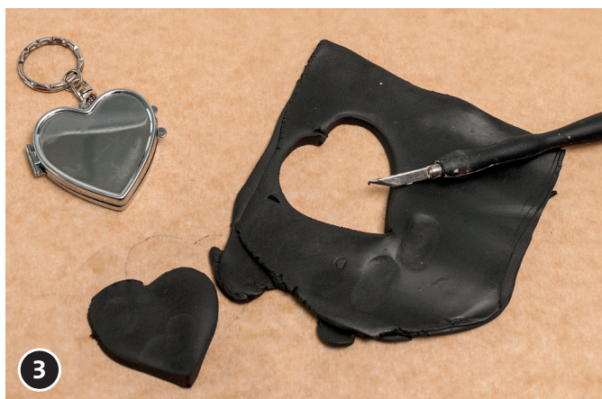
3 Hart van klei uit de plaat halen.