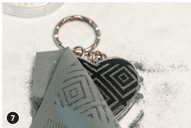
7 Sjabloon verwijderen.