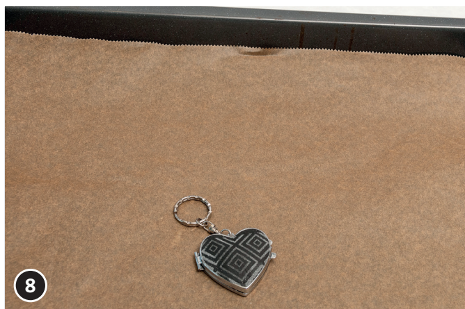
8 Hart spiegel op 110°C, 30 minuten in de oven harden.

Voor de andere spiegel en de tashouder is deze handleiding ook van toepassing.