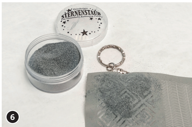
6 Embossing poeder op het sjabloon strooien, voorzichtig met de vingers op de klei aandrukken.