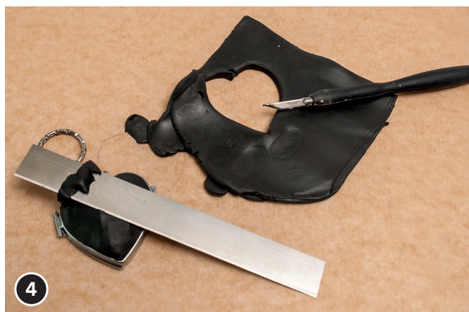
4 Gemodelleerd hart in de holling van de hart spiegel plaats. De klei aandrukken, overtollige klei (aan de rand) met het Fimo mes verwijderen.